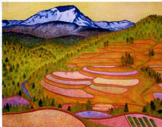
「馬型の見える棚田」 新潟県旧安塚町菱ヶ岳